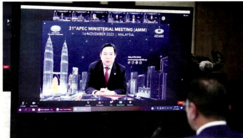
UCAPAN pembukaan Mesyuarat Menteri Kerjasama Ekonomi Asia Pasifik (AMM) diadakan secara maya julang kalinya, semalam.

"Tahun ini juga menyaksikan kami menghidupkan semula usaha ke arah pemulihan dan pertumbuhan ekonomi serta mendekati Apec kepada masyarakat," katanya dalam ucapan perasmian Mesyuarat Menteri Kerjasama