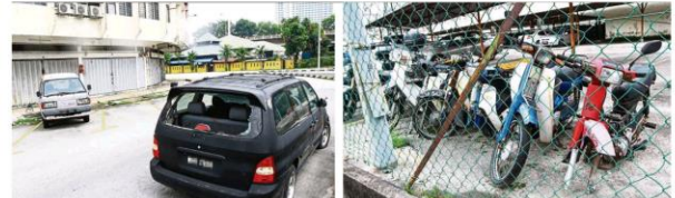
A car with its back window smashed, has been left on a neighbourhood road off Jalan Raya Barat, Klang for at least two years. Old motorcycles are also left abandoned within the compound of the Bayu Perdana flats in Klang.

Klang Municipal Council has a busy time towing away abandoned cars from the streets. It has removed over 900 such vehicles and more are pending as investigations are being carried out. >3