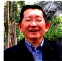
The Gamuda Parks initiative will be able to create a more pleasant, liveable environment for the community, said Chung.

AS one of the top leading property developers in Malaysia, Gamuda Land has been actively doing its part to create a better environment for its community.