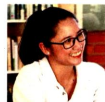
The Gamuda Parks team has done an excellent job in terms of sustainable development, said Fletcher.

"In my opinion, Gamuda Parks is heading in the right direction.