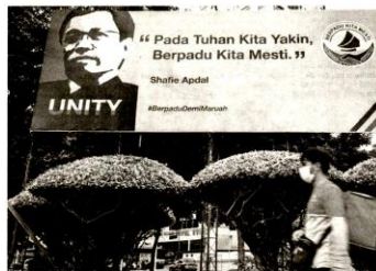
PAPAN tanda yang dipagut Warisan sempena Pilihan Raya Negeri Sabah, September lalu.

Apa malahan balas dendam hendaklah? Saya malahan balas dendam dengan memertina beberapa cadangan yang saya kemukakan. Bagaimanapun, saya mengambil kira tidak Yang di-Pertuan Agong, Al-Sultan Abdullah II dan Perdana Menteri. Saya malahan balas dendam dengan memertina beberapa cadangan yang saya kemukakan. Bagaimanapun, saya mengambil kira tidak Yang di-Pertuan Agong, Al-Sultan Abdullah II dan Perdana Menteri. Saya malahan balas dendam dengan memertina beberapa cadangan yang saya kemukakan. Bagaimanapun, saya mengambil kira tidak Yang di-Pertuan Agong, Al-Sultan Abdullah II dan Perdana Menteri.