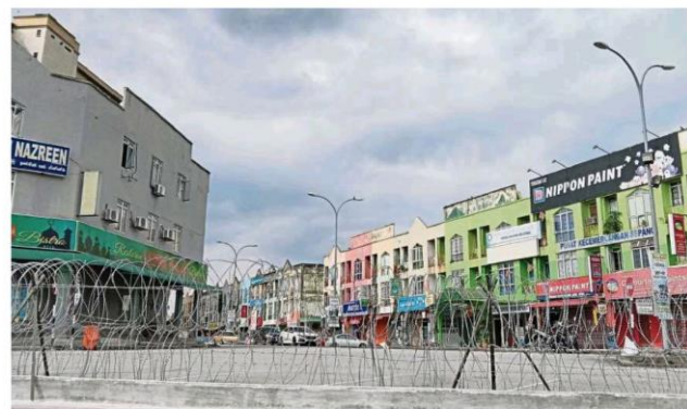
Medan 88 has turned into a ghost town as businesses are shuttered and remaining residents are ordered to stay indoors.

"I never had the chance to do so before. I have no solid plans as to what I intend to do yet with my