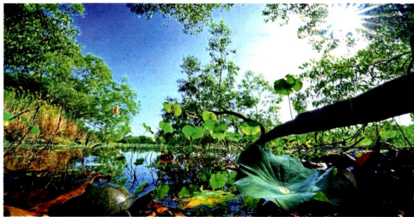
Gamuda Parks aims to create a space where township residents and nature can co-exist harmoniously in the same habitat. Actual photo: Paya Indah Discovery Wetlands

Gamuda Parks aims to preserve the well-being of the land in its townships