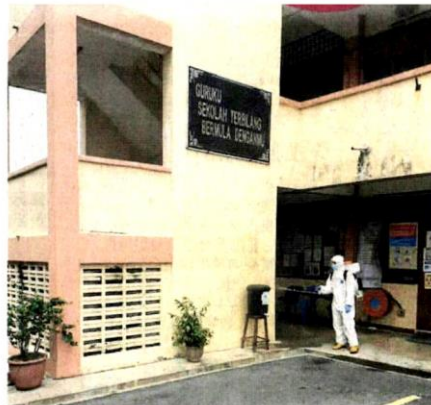
■前线人员为学院消毒。