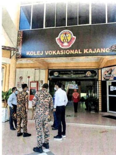
■消毒隊伍來到加影技術學院。

另外，執法組也針對民眾對小販的投訴到多地進行調查，包括到哥打花園、美華花園、英丹花園、流古仙特拉、土毛月彩虹花園以及高峰紹佳納花園，並在行動中發出8張警告信、1張罰款和充公3個小販攤位。