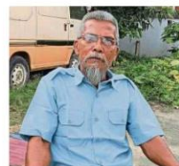
Arffain is doing maintenance work around the house and has plans to sell tapai pulut online to overcome losses in his hotel business.