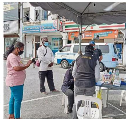
An office cleaner (left) and bank security guard awaiting their turn to be screened for Covid-19 in Medan 88, Bandar Baru Salak Tinggi in Sepang.

spare time but once the lockdown is lifted, I will head back to work," she said.