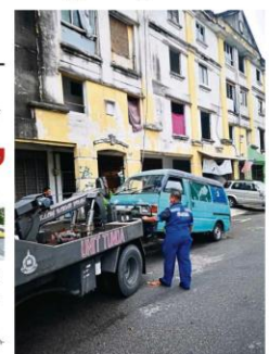
MPC towing away a van left in a commercial area in Klang.