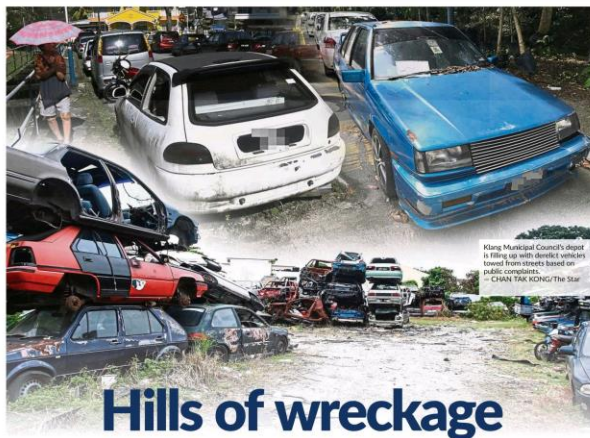
Klang Municipal Council's depot is filling up with derelict vehicles towed from streets based on public complaints.