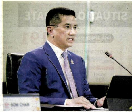
Azmin chairing the APEC Ministerial Meeting virtually on Monday of the APEC 2020 Malaysia meeting. Malaysia has begun to work on the Leaders' Declaration, says Azmin

"We affirm the importance of agreed-upon rules in the WTO, which enhance market predictability,